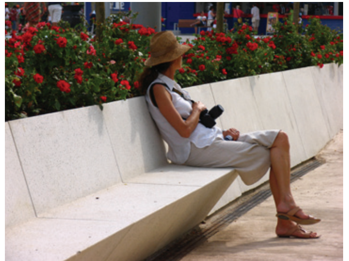
Proyecto Recinto Expo Zaragoza 2008, Zaragoza (España)

DISEÑADO PARA CONFORMAR LIMITES, CONTENER TIERRAS Y FORMAR ALINEACIONES