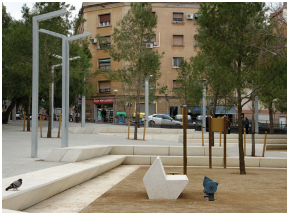
Proyecto Parc dels Ocellets, Barcelona (España)