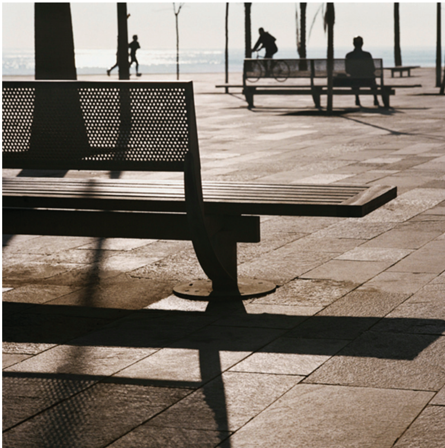
Proyecto Barceloneta, Barcelona (España)