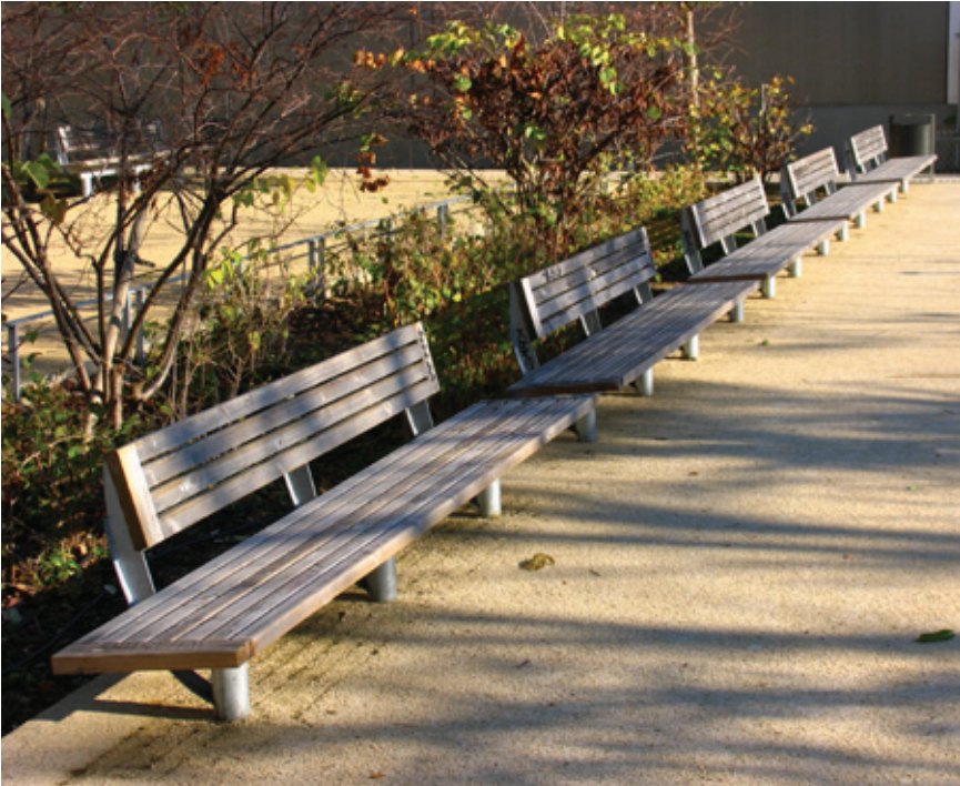
Vaucanson, Patin (France)