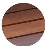
bois tropical FSC