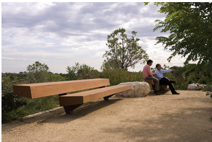
Port Aventura, Salou (Espagne)