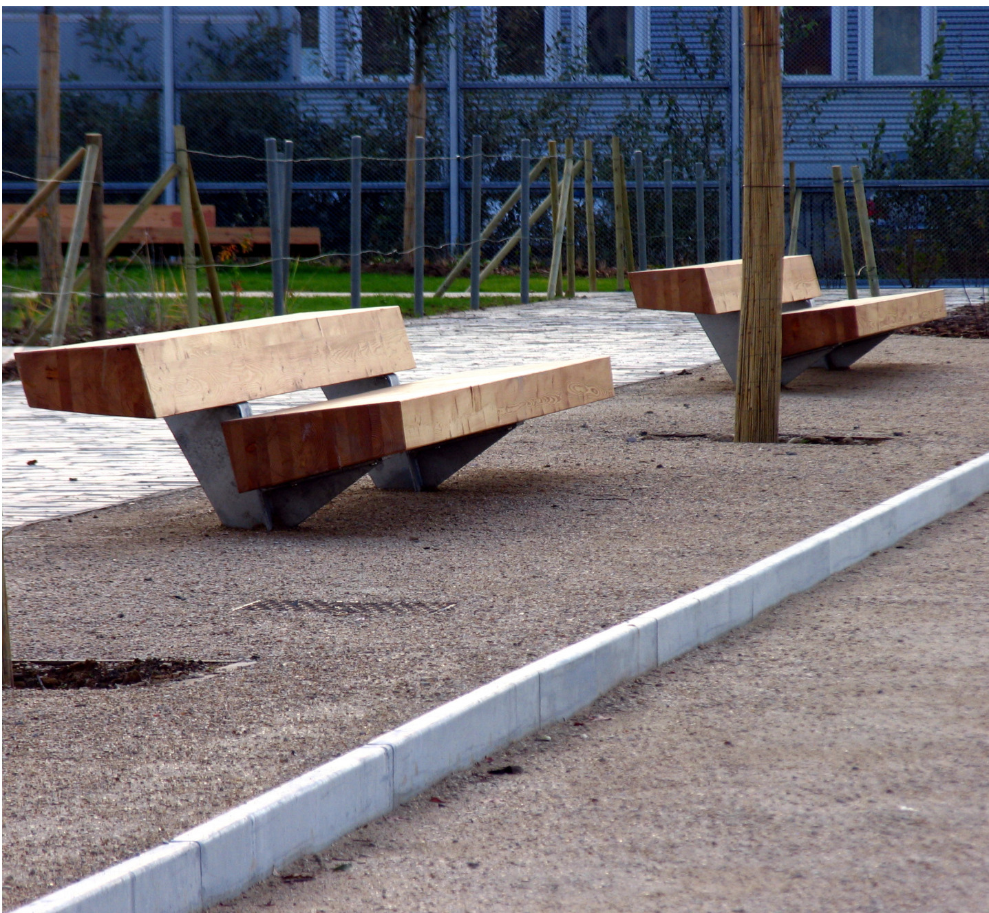
Clichy Batignoles Parc, Paris (France)