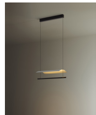
Lámina 45 / 85