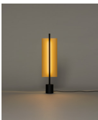
Lámina Dorada 45