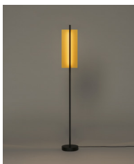
Lámina Dorada 45