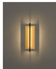
Lámina Dorada 45